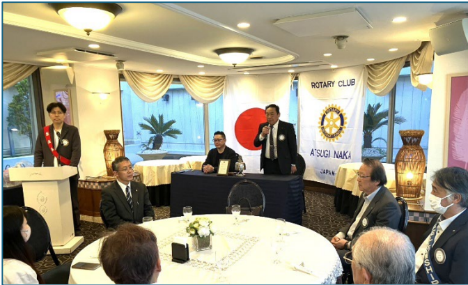
チャーターナイト記念夜間例会