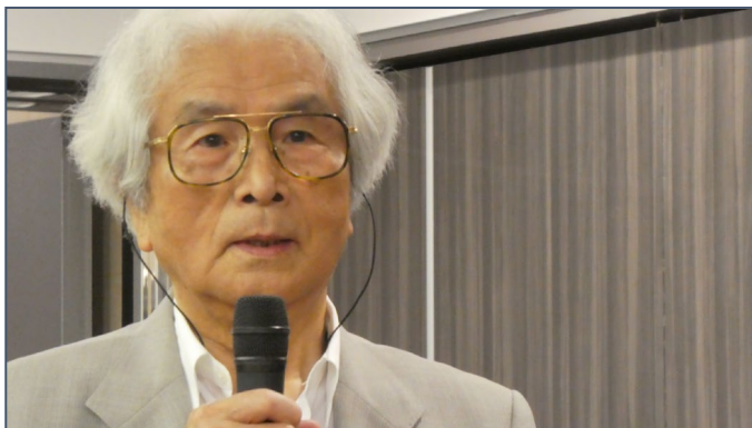
ロータリー財団米山への寄付（1000ドル）