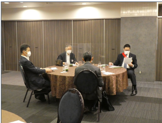
一例会スケジュールー 点鐘 12:30 会場 厚木アーバンホテル

西大良会員の卓話、楽しみにしております。本日少し早めに退席させていただきます。申し訳ございません。