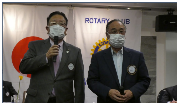
朝倉会員、長い間お世話になりました。