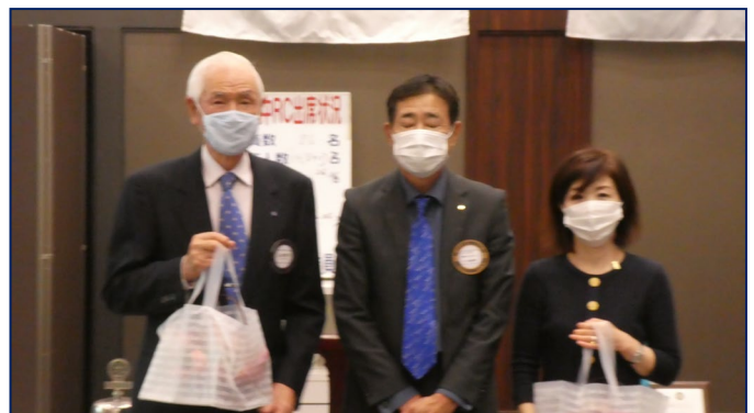
会員誕生日 山崎会員 11/29 中村会員 11/20