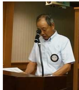
鈴木会員 初スマイル発表!?